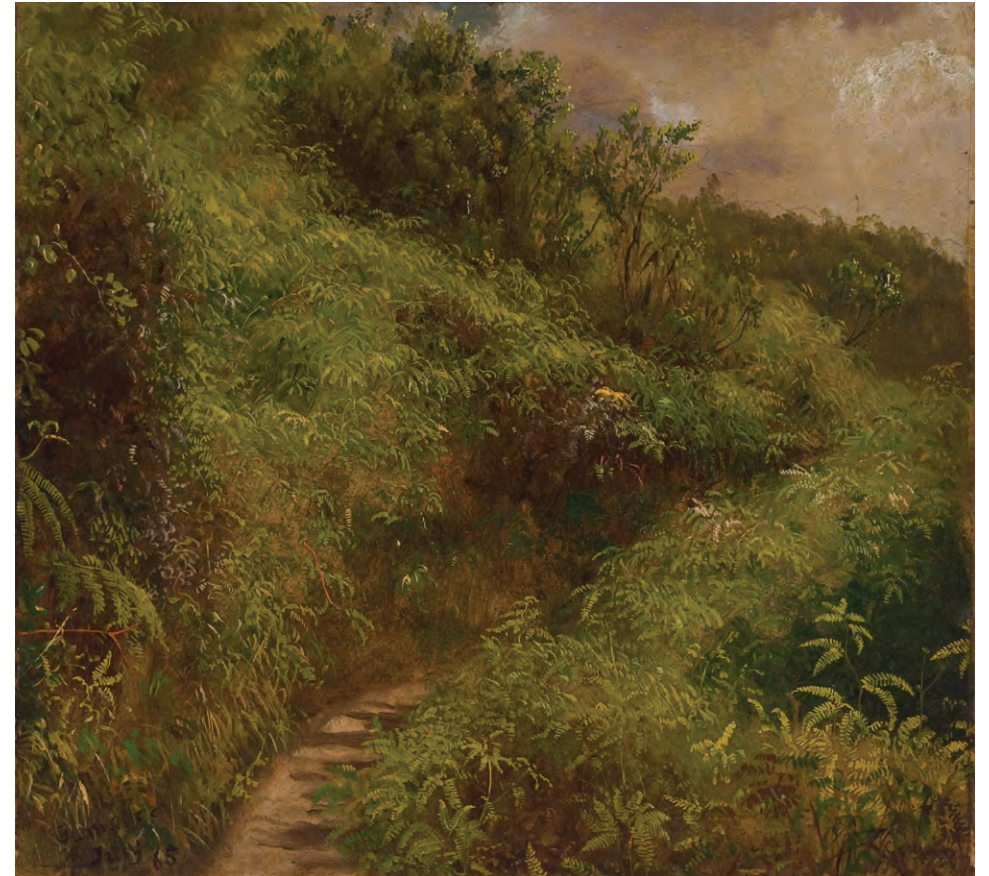
Frederic Edwin Church (1826–1900), Fern Walk, Jamaica , 1865. Óleo sobre papel, montado sobre lienzo. 12¼ × 13¼ in. (31.1 × 33.6 cm). Oficina de Parques, Recreación y Preservación Histórica del Estado de Nueva York. Olana State Historic Site. Donación de Olana Preservation, Inc. y adquisición del museo, OL.1981.73.a

En medio de una intensa actividad, Church dirigió su atención a la topografía, la botánica y la meteorología del paisaje tropical, produciendo exquisitos estudios al óleo al aire libre , muchos de los cuales enmarcó y colgó posteriormente en Olana. Durante su estancia de cinco meses, Church recorrió la isla en tren, a caballo y a pie para obtener vistas elevadas desde la cima del Monte Diablo, desde donde se observa Saint Thomas in the Vale Parish y las Blue Mountains. A partir de numerosos bocetos y estudios al óleo, creó las obras principales Rainy Season in the Tropics (1866) y Vale of St. Thomas, Jamaica (1867), esta última un importante encargo que recibió de su amiga Elizabeth Hart Jarvis Colt. En esta pintura, el paisaje tormentoso de Church, con el sol esforzándose por abrirse paso entre las nubes, alude al final de la Guerra Civil estadounidense y a los brutales legados de la esclavitud que persistían. Solo unas semanas después de que los Church abandonaran Jamaica, una protesta armada de personas anteriormente esclavizadas fue violentamente reprimida por orden del gobernador colonial británico Edward Eyre, a quien los Church habían conocido durante su estancia. El incidente, conocido como la Rebelión de Morant Bay, provocó un intenso debate sobre el dominio colonial en el Caribe.