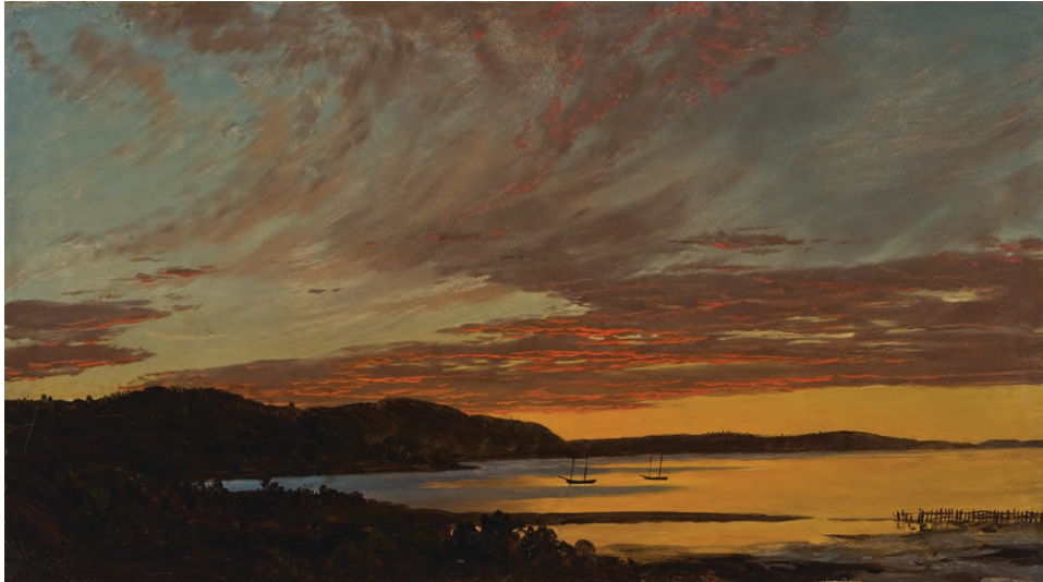
Frederic Edwin Church (1826–1900), Sunset, Bar Harbor , 1854. Óleo sobre papel, montado sobre lienzo. 10 \frac{1}{8} × 17 \frac{1}{4} in. (25.7 × 43.8 cm). Oficina de Parques, Recreación y Preservación Histórica del Estado de Nueva York. Olana State Historic Site. Donación de Olana Preservation, Inc. y adquisición del museo, OL.1981.72.a

Tras la muerte de Cole en 1848, Church siguió su propio camino, viajando a muchos de los grandes paisajes naturales del país para representarlos de maneras nuevas e innovadoras. Entre 1856 y 1858 realizó cuatro viajes a las cataratas del Niágara, donde ejecutó decenas de dibujos a lápiz y estudios al óleo. Pintada en formato panorámico, su "Gran Cuadro" Niagara (1857) fue un ejemplo pionero de lo sublime estadounidense. Niagara alcanzó un enorme éxito y recorrió Estados Unidos y Gran Bretaña en exhibiciones itinerantes.