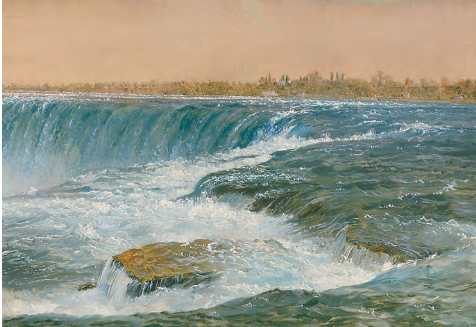
Frederic Edwin Church (1826–1900), Horseshoe Falls , diciembre de 1856–enero de 1857. Óleo sobre dos hojas de papel unidas, montadas sobre lienzo. 11½ × 35⅝ in. (29.2 × 90.5 cm). Oficina de Parques, Recreación y Preservación Histórica del Estado de Nueva York. Olana State Historic Site. Donación de Olana Preservation, Inc. y adquisición del museo, OL.1981.15.a