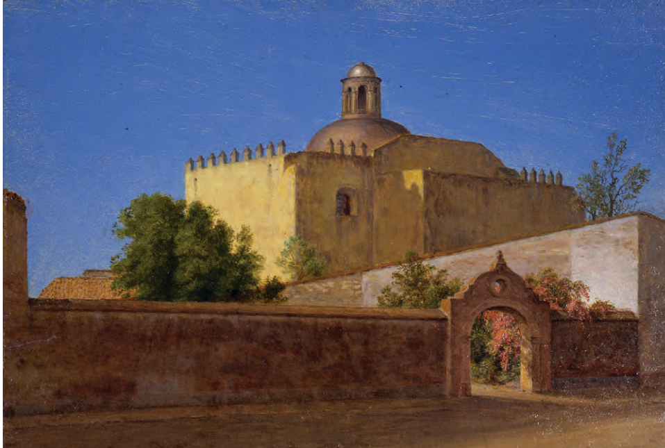
Frederic Edwin Church (1826–1900), Church of San Francisco, Cuernavaca, Mexico , enero-febrero de 1898. Óleo sobre tabla. 7¼ × 11½ in. (19.7 × 29.2 cm). Oficina de Parques, Recreación y Preservación Histórica del Estado de Nueva York. Olana State Historic Site. Donación de Olana Preservation, Inc. y adquisición del museo, OL.1977.226

En las últimas décadas de su vida, Church viajó a diversas regiones de México, realizando quince viajes entre 1881 y su muerte en 1900. Buscaba climas cálidos durante los fríos meses de invierno del valle del Hudson, para aliviar los efectos de su artritis reumatoide. Al mismo tiempo, desarrolló una profunda apreciación por el arte, la arquitectura, la historia y el paisaje de México, lo cual se reflejó en el diseño y la decoración del estudio que añadió a su casa entre 1888 y 1890. Sus viajes a bordo del Ferrocarril Nacional Mexicano lo llevaron a recorrer el país, dando como resultado una notable y fascinante serie de dibujos y bocetos al óleo de la diversa topografía y de los monumentos arquitectónicos de México. La destreza y el seguro dominio del dibujo que muestran estos estudios desmienten por completo la idea de que Church abandonó su práctica artística en su vejez.