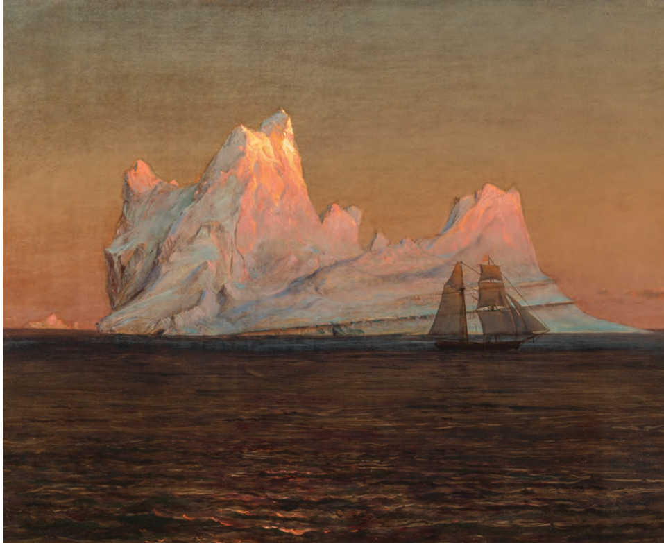
Frederic Edwin Church (1826-1900), The Iceberg , c. 1875. Óleo sobre lienzo. 22 × 27 in. (55.9 × 68.6 cm). Terra Foundation for American Art, Chicago. Daniel J. Terra Collection, 1993.6